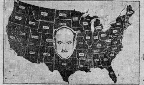
En el centro mismo de los Estados Unidos en el Estado de Kansas, la candidatura republicana del Reverendo Winrod (al centro) ha puesto en alarma a los enemigos del fascismo que temen verlo aparecer cada día en alguna parte de la Unión.

bre vencerá el candidato demócrata George Mc Gill. El pánico proviene de que un nazista 100 por ciento haya podido hasta ahora sostener su nombre en una votación a la cual se le ha dado carácter ideológico, erróneamente, pues según Ernest Warden, no hay que olvidarse que Kansas es la tierra del pequeño comerciante y del pequeño agricultor que odia por igual a los bancos y a los rojos.